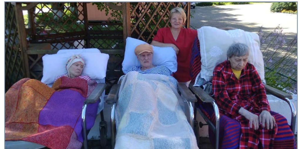
[Text & Bild: Helia Sauerwein]

Da in diesem Jahr keine Weihnachtsmärkte stattfinden dürfen, möchten wir Freunde und Unterstützer der „Brücke nach Kaliningrad“ herzlich um eine Spende für die Aufrechterhaltung unserer Arbeit auf das Konto beim Kirchenamt Celle, Stichwort: Brücke nach Kaliningrad IBAN: DE53 2515 2375 0045 0295 27 bitten.