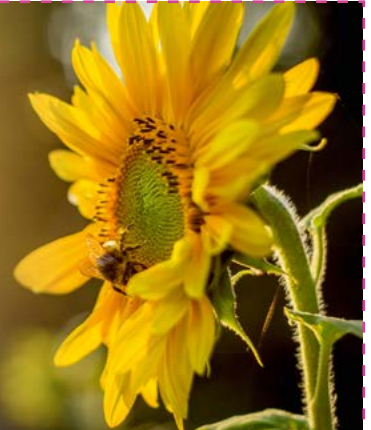
Text: Einheitsübersetzung der Heiligen Schrift, revidiert 2017; © 2017 Katholische Bibelanstalt, Stuttgart - Grafik: © Gemeindebrief/Druckerei

Jesus Christus spricht: Liebt eure Feinde und betet für die, die euch verfolgen, damit ihr Kinder eures Vaters im Himmel werdet. Matthäus 5,44-45