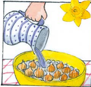
[Text: Tina Meyn]

Setze einige Narzissenzwiebeln mit der Spitze nach oben in eine mit Steinen gefüllte Schale. Fülle die Schale bis zur Unterseite der Zwiebeln mit Wasser. Stell die Schale für zwei Wochen an einen kühlen und dunklen Ort. Wenn sich zarte weiße Wurzeln bilden, stell die Schale auf ein sonniges Fensterbrett. Bald erlebst du dein blühendes Wunder!