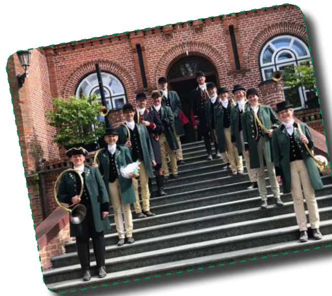
„bien aller“ aus Verden, aufgenommen am Gut Goertz in Schleswig-Holstein

kommt der Parforcebläserchor „bien aller“ aus Verden zu uns. Die musikalischen Stücke haben eine große Ausdruckskraft und auch die jagdlich geschmückte Kirche ist jedes Mal wieder etwas wirklich Besonderes. Herzliche Einladung an die ganze Gemeinde und Gäste.